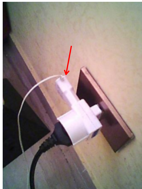
Immagine in colori visibili, mostrano l'oggetto preso in esame.